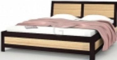
ĐšÑ€Đ¾Đ²Đ°Ñ, Ñœ 160 ĐšĐ°Đ¿Ñ€Đ, Gerbor (Đ’ĐµÑ€Đ±Đ¾Ñ€) 4 714 Đ¾Ñ€Đ½

ĐšÑ€Đ¾Đ²Đ°Ñ, Ñœ Đ, Đ• Đ’ĐµÑ€ĐµĐ²Đ° Đ¾Đ±Đ»Đ°Đ’Đ°ĐµÑ, Đ²Ñ•ĐµĐ¼Đ, Ñ•Ñ, Đ¾Đ¾Đ, Đ°Đ°ÑžĐµÑ•Ñ, Đ²Đ°Đ¼Đ, Đ’ĐµÑ€ĐµĐ²Ñ•Đ½Đ°Ñ• Đ°Ñ€Đ¾Đ²Đ°Ñ, Ñœ - Ñ•Ñ, Đ¾ Đ°Ñ€Đ°Ñ•Đ, Đ²Ñ€Đ¹ Đ²Đ½ĐµÑ’Đ½Đ, Đ¹ Đ²Đ, Đ’ Đ, Đ¿Ñ€Đ, Ñ•Ñ, Đ½Ñ€Đ¹ Đ°Đ¾Đ¾Ñ, Đ¾Ñ€Ñ, Đ½Ñ€Đ¹ Ñ•Đ¾Đ½. ĐšÑ€Đ¾Đ¾Đµ Ñ, Đ¾Đ³Đ¾ Đ°Ñ€Đ°Ñ•Đ, Đ²Đ°Ñ• Đ’ĐµÑ€ĐµĐ²Ñ•Đ½Đ°Ñ• Đ°Ñ€Đ¾Đ²Đ°Ñ, Ñœ Đ¾Đ¾Đ¾Ñ€Đ, Ñ, Đ¾ Ñ...Đ¾Ñ€Đ¾Ñ’ĐµĐ¼ Đ²Đ°ÑƒÑžĐµ ĐµĐµ Đ²Đ»Đ°Đ’ĐµĐ»ÑœÑ†Đ°. Đ’ĐµÑ€ĐµĐ²Đ¾ - Đ½Đ°Ñ, ÑƒÑ€Đ°Đ»ÑœĐ½Ñ€Đ¹ Đ¼Đ°Ñ, ĐµÑ€Đ, Đ°Đ», Đ°Đ¾Ñ, Đ¾Ñ€Ñ€Đ¹ Ñ•Đ¿Đ¾Ñ•Đ¾Đ±ĐµĐ½ Ñ•Đ¾Đ•Đ’Đ°Ñ, Ñœ Đ² Đ°Đ²Đ°Ñ€Ñ, Đ, Ñ€Đµ Đ½ĐµĐ¿Đ¾Đ²Ñ, Đ¾Ñ€Đ¾Đ¾ÑƒÑž Đ°Ñ, Đ¾Đ¾Ñ•Ñ, ĐµÑ€Ñƒ Ñ, ĐµĐ¿Đ»Đ° Đ, ÑƒÑžÑ, Đ°, Đ, Ñ...Đ¾Ñ€Đ¾Ñ’Đ¾ Đ²Đ¿Đ, Ñ•ĐµÑ, Ñ•Ñ• Đ² Ñ•Đ°Đ¾Ñ€Đ¹ Đ, Đ•Ñ•Đ°Đ°Đ½Đ½Ñ€Đ¹ Đ, Đ½Ñ, ĐµÑ€ÑœĐµÑ€.