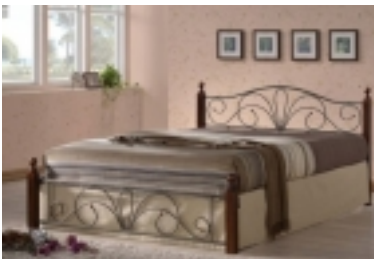
ĐšŃ€Đ¼Đ²Đ°Ń,ŃŒ AT-9181 Onder Metal 180-200 3 185 Đ³Ń€Đ½

Đ“Đ°Đ±Đ°Ń€Đ,Ń,Đ½Ń«Đµ Ń€Đ°Đ-Đ¼ĐµŃ€Ń« Đ°Ń€Đ¼Đ²Đ°Ń,Đ,; Đ'Ń«Ń•Đ¼Ń,Đ° (Ń€Đ°Ń•Ń•Ń,Đ¼Ń•Đ½Đ,Đµ Đ¼Ń, Đ¿Đ¼Đ»Đ° Đ'Đ¼ Ń•Đ°Đ¼Đ¼Đ¹ Đ²ĐµŃ€Ń...Đ½ĐµĐ¹ Ń,Đ¼Ń±Đ°Đ,), Đ¼Đ¼ 1050 Đ"Đ,Ń€Đ,Đ½Đ°, Đ¼Đ¼ 1700 Đ"Đ»Đ,Đ½Đ°, Đ¼Đ¼ 2100 [ĐŸĐ¼Đ'Ń€Đ¼Đ±Đ½ĐµĐµ...]