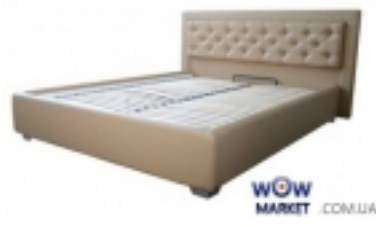
ĐšŃ€Đ³⁄₄Đ²Đ°Ń,ŃŒ Đ•Đ¿Đ³⁄₄Đ»Đ³⁄₄Đ¹⁄₂ Ń• Đ¿Đ³⁄₄Đ´ŃŒŒĐμĐ¹⁄₄Đ¹⁄₂Ń•Đ¹⁄₄ Đ¹⁄₄ĐμŃ...Đ°Đ¹⁄₂Đ₃,Đ•Đ¹⁄₄Đ³⁄₄Đ¹⁄₄ Novelty (Đ•Đ³⁄₄Đ²ĐμĐ»Ń,Đ₃) 6 704 Đ³Ń€Đ¹⁄₂

Đ“Đ°Đ±Đ°Ń€Đ₃,Ń,Đ¹⁄₂Ń«Đμ Ń€Đ°Đ•Đ¹⁄₄ĐμŃ€Ń« Đ°Ń€Đ³⁄₄Đ²Đ°Ń,Đ₃: 153Ń...210 Ń•Đ¹⁄₄, 173Ń...210 Ń•Đ¹⁄₄, 193Ń...210 Ń•Đ¹⁄₄ Đ'Ń«Ń•Đ³⁄₄Ń,Đ° Đ₃,Đ•Đ³⁄₄Đ»Đ³⁄₄Đ²ŃŒŃ°: 100 Ń•Đ¹⁄₄ Đ•Đ³⁄₄Đ¶Đ°Đ₃: Ń...Ń€Đ³⁄₄Đ¹⁄₄Đ,Ń€Đ³⁄₄Đ²Đ°Đ¹⁄₂Đ¹⁄₂Ń«Đμ, 5 Ń•Đ¹⁄₄ ĐšĐ°Ń€Đ°Đ°Ń°: Đ¹⁄₄ĐμŃ,Đ°Đ»Đ»Đ,Ń‡ĐμŃ•Đ°Đ,Đ¹ Đ•Đ³⁄₄Đ°Đ³⁄₄Đ²Đ₃,Đ¹⁄₂Ń« Đ₃, Đ₃,Đ•Đ³⁄₄Đ»Đ³⁄₄Đ²ŃŒŒĐμ: Đ”Đ¿ĐŸ Ń• Đ¹⁄₂Đ°Đ¿Đ³⁄₄Đ»Đ¹⁄₂ĐμĐ¹⁄₂Đ,ĐμĐ¹⁄₄ ĐŸĐŸĐŒ Đ₃,Ń•Đ₃,Đ¹⁄₂Ń,ĐμĐ¿Đ³⁄₄Đ¹⁄₂Đ° ĐžŃ•Đ¹⁄₂Đ³⁄₄Đ²Đ°Đ¹⁄₂Đ₃,Đμ Đ¿Đ³⁄₄Đ´ Đ¹⁄₄Đ°Ń,Ń€Đ°Ń°: Đ¹⁄₄ĐμŃ,Đ°Đ»Đ»Đ,Ń‡ĐμŃ•Đ°Đ,Đ¹ Đ°Đ°Ń€Đ°Đ°Ń° Ń• Đ³⁄₄Ń€Ń,Đ³⁄₄Đ¿ĐμĐ [ĐŸĐ³⁄₄Đ´Ń€Đ³⁄₄Đ±Đ¹⁄₂ĐμĐμ...]