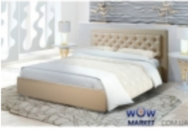
ĐšŃ€Đ³⁄₄Đ²Đ°Ń,ŃŒ Đ•Đ¿Đ³⁄₄Đ»Đ³⁄₄Đ¹⁄₂ Novelty (Đ•Đ³⁄₄Đ²ĐμĐ»Ń,Đ₃) 5 936 Đ³Ń€Đ¹⁄₂

Đ“Đ°Đ±Đ°Ń€Đ₃,Ń,Đ¹⁄₂Ń«Đμ Ń€Đ°Đ•Đ¹⁄₄ĐμŃ€Ń« Đ°Ń€Đ³⁄₄Đ²Đ°Ń,Đ₃: 153Ń...210 Ń•Đ¹⁄₄, 173Ń...210 Ń•Đ¹⁄₄, 193Ń...210 Ń•Đ¹⁄₄ Đ'Ń«Ń•Đ³⁄₄Ń,Đ° Đ₃,Đ•Đ³⁄₄Đ»Đ³⁄₄Đ²ŃŒŃ°: 100 Ń•Đ¹⁄₄ Đ•Đ³⁄₄Đ¶Đ°Đ₃: Ń...Ń€Đ³⁄₄Đ¹⁄₄Đ,Ń€Đ³⁄₄Đ²Đ°Đ¹⁄₂Đ¹⁄₂Ń«Đμ, 5 Ń•Đ¹⁄₄ ĐšĐ°Ń€Đ°Đ°Ń°: Đ¹⁄₄ĐμŃ,Đ°Đ»Đ»Đ,Ń‡ĐμŃ•Đ°Đ,Đ¹ Đ•Đ³⁄₄Đ°Đ³⁄₄Đ²Đ₃,Đ¹⁄₂Ń« Đ₃, Đ₃,Đ•Đ³⁄₄Đ»Đ³⁄₄Đ²ŃŒŒĐμ: Đ”Đ¿ĐŸ Ń• Đ¹⁄₂Đ°Đ¿Đ³⁄₄Đ»Đ¹⁄₂ĐμĐ¹⁄₂Đ,ĐμĐ¹⁄₄ ĐŸĐŸĐŒ Đ₃,Ń•Đ₃,Đ¹⁄₂Ń,ĐμĐ¿Đ³⁄₄Đ¹⁄₂Đ° ĐžŃ•Đ¹⁄₂Đ³⁄₄Đ²Đ°Đ¹⁄₂Đ₃,Đμ Đ¿Đ³⁄₄Đ´ Đ¹⁄₄Đ°Ń,Ń€Đ°Ń°: Đ¹⁄₄ĐμŃ,Đ°Đ»Đ»Đ,Ń‡ĐμŃ•Đ°Đ,Đ¹ Đ°Đ°Ń€Đ°Đ°Ń° Ń• Đ³⁄₄Ń€Ń,Đ³⁄₄Đ¿ĐμĐ [ĐŸĐ³⁄₄Đ´Ń€Đ³⁄₄Đ±Đ¹⁄₂ĐμĐμ...]