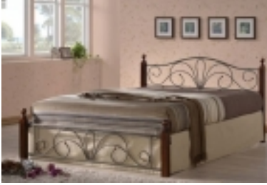
ĐšŃ€Đ¼Đ²Đ°Ń,ŃŒ AT-9181 Onder Metal 160-200 2 965 Đ³Ń€Đ½

Đ“Đ°Đ±Đ°Ń€Đ,Ń,Đ½Ń«Đµ Ń€Đ°Đ-Đ¼ĐµŃ€Ń« Đ°Ń€Đ¼Đ²Đ°Ń,Đ,; Đ'Ń«Ń•Đ¼Ń,Đ° (Ń€Đ°Ń•Ń•Ń,Đ¼Ń•Đ½Đ,Đµ Đ¼Ń, Đ¿Đ¼Đ»Đ° Đ'Đ¼ Ń•Đ°Đ¼Đ¼Đ¹ Đ²ĐµŃ€Ń...Đ½ĐµĐ¹ Ń,Đ¼Ń±Đ°Đ,), Đ¼Đ¼ 1050 Đ"Đ,Ń€Đ,Đ½Đ°, Đ¼Đ¼ 1700 Đ"Đ»Đ,Đ½Đ°, Đ¼Đ¼ 2100 [ĐŸĐ¼Đ'Ń€Đ¼Đ±Đ½ĐµĐµ...]