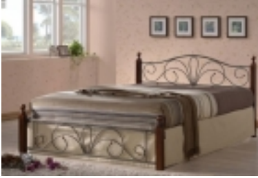
ĐšÑ€Đ¼Đ²Đ°Ñ,ÑŒ AT-9181 Onder Metal 160-200 2 965 Đ³Ñ€Đ½

Đ“Đ°Đ±Đ°Ñ€Đ,Ñ,Đ½Ñ«Đµ Ñ€Đ°Đ-Đ¼ĐµÑ€Ñ« Đ°Ñ€Đ¼Đ²Đ°Ñ,Đ,; Đ'Ñ«Ñ•Đ¼Ñ,Đ° (Ñ€Đ°Ñ•Ñ•Ñ,Đ¼Ñ•Đ½Đ,Đµ Đ¼Ñ, Đ¿Đ¼Đ»Đ° Đ'Đ¼ Ñ•Đ°Đ¼Đ¼Đ¹ Đ²ĐµÑ€Ñ...Đ½ĐµĐ¹ Ñ,Đ¼Ñ±Đ°Đ,), Đ¼Đ¼ 1050 Đ"Đ,Ñ€Đ,Đ½Đ°, Đ¼Đ¼ 1700 Đ"Đ»Đ,Đ½Đ°, Đ¼Đ¼ 2100 [ĐŸĐ¼Đ'Ñ€Đ¼Đ±Đ½ĐµĐµ...]