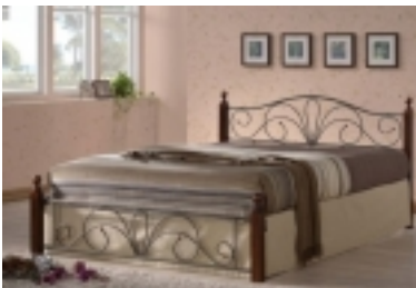
ĐšÑ€Đ¼Đ²Đ°Ñ,ÑŒ AT-9181 Onder Metal 180-200 3 185 Đ³Ñ€Đ½

Đ“Đ°Đ±Đ°Ñ€Đ,Ñ,Đ½Ñ«Đµ Ñ€Đ°Đ-Đ¼ĐµÑ€Ñ« Đ°Ñ€Đ¼Đ²Đ°Ñ,Đ,; Đ'Ñ«Ñ•Đ¼Ñ,Đ° (Ñ€Đ°Ñ•Ñ•Ñ,Đ¼Ñ•Đ½Đ,Đµ Đ¼Ñ, Đ¿Đ¼Đ»Đ° Đ'Đ¼ Ñ•Đ°Đ¼Đ¼Đ¹ Đ²ĐµÑ€Ñ...Đ½ĐµĐ¹ Ñ,Đ¼Ñ±Đ°Đ,), Đ¼Đ¼ 1050 Đ"Đ,Ñ€Đ,Đ½Đ°, Đ¼Đ¼ 1700 Đ"Đ»Đ,Đ½Đ°, Đ¼Đ¼ 2100 [ĐŸĐ¼Đ'Ñ€Đ¼Đ±Đ½ĐµĐµ...]